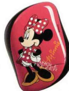
Minnie Mousae et maxi crush. Compact Styler, Tangle Teezer , 16,50 €.