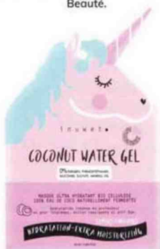
La licorne nous fait toujours autant rêver. Coconut Water Gel Masque ultra-hydratant , Inuwet, 6 €. Exclu De Bruyère Beauté.

La grande récré Les rayons beauté nous content une véritable toy story. Entre nostalgie et produits kawaii , difficile de résister à ces produits fun ou girly. PAR V.G.