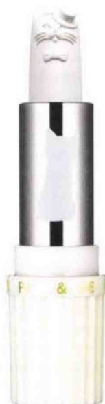
On ronronne de plaisir devant cet illuminateur nacré. Stick illuminateur , Paul & Joe Beauté, 27 €.