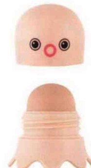
Cet anticernes pieuvre est la preuve qu'on peut être mignon et efficace. Tako Color Corrector , TonyMoly, 11,99 €. Exclu Sephora.