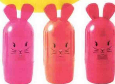
Trois mini rouges à lèvres lapins à croquer. Bunny Trio Set , Nocibé, 12,95 €.