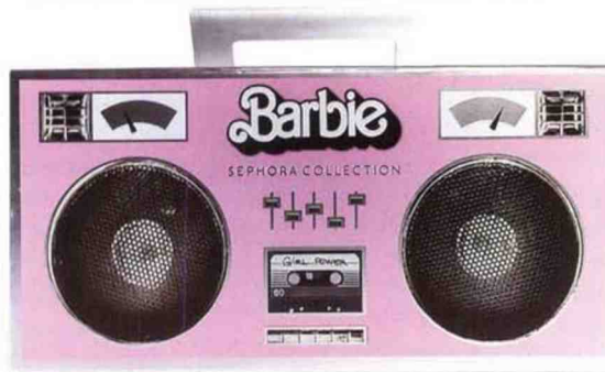
Qui a dit qu'on était trop grandes pour jouer à la poupée ? Coffret maquillage, Sephora x Barbie , 29,95 €. Exclu Sephora.fr.