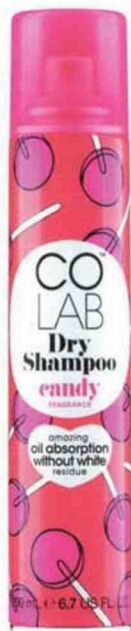
Un shampoing sec gourmand au parfum de bonbon. Shampoing sec Candy , Colab, 4,99 €. Exclu Monoprix.