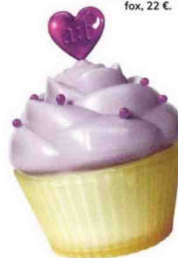
Une petite douceur pour la peau. Crème apaisante visage , at fox, 22 €.

La grande récré Les rayons beauté nous content une véritable toy story. Entre nostalgie et produits kawaii , difficile de résister à ces produits fun ou girly. PAR V.G.