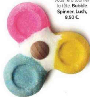
Ce pain moussant vous fera tourner la tête. Bubble Spinner , Lush, 8,50 €.