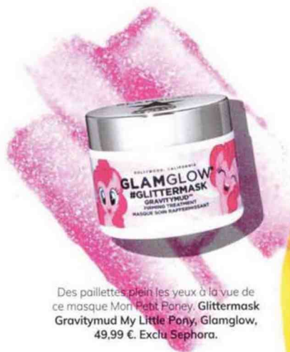
Des paillettes plein les yeux à la vue de ce masque Mon Petit Poney. Glittermask Gravitymud My Little Pony , Glamglow, 49,99 €. Exclu Sephora.