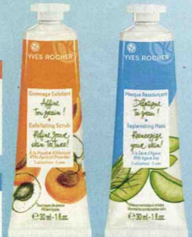
Gommage et masques Yves Rocher - 7,90 €

Réveillez votre teint ! Il booste et réveille l'éclat de la peau. Ce masque à l' argousier offre un véritable coup de fouet aux peaux ternes.