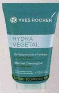
Gel nettoyant ultra-fraîcheur Yves Rocher - 9 €