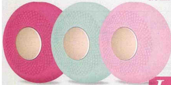
UFO mini Foreo - 179 €

Le masque, nouvelle génération... Foreo lance le masque connecté qui offre un traitement complet pour le visage en seulement 90 secondes grâce à sa technologie pointue qui allie réchauffement, pour ouvrir les pores, et pulsations T-Sonic™ afin d'infuser activement les ingrédients plus en profondeur sous la peau.