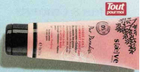
Masque 2-en-1 gommant purifiant S(a)ève

Le masque, nouvelle génération... Foreo lance le masque connecté qui offre un traitement complet pour le visage en seulement 90 secondes grâce à sa technologie pointue qui allie réchauffement, pour ouvrir les pores, et pulsations T-Sonic™ afin d'infuser activement les ingrédients plus en profondeur sous la peau.