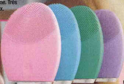
Luna 2 Foreo - 199 €