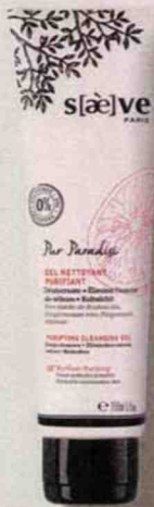
Gel nettoyant purifiant S(æ)ve - 12,20 €